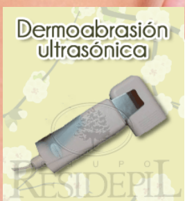
OPCIONAL Dermoabrasión ultrasónica

Cuatro programas: De forma preestablecida el SLIM MASTER ofrece cuatro programas con diferentes niveles de potencia para el tratamiento de alteraciones.