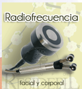
OPCIONAL Mando RF Corporal

Ahora Grupo Residepil incorpora a su Radiofrecuencia doble Acción la eficacia del drenaje a través de la Endermología Cromática , y todo en un sólo mando, de esta forma SLIM MASTER hace más eficaz y rápidos los resultados en la lucha contra la eliminación de los adipocitos.