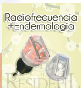
Mando Combi RF + Endermología Cromática

El SLIM MASTER viene equipado con Radio Frecuencia Corporal combinada con Endermología Cromática y Radio Frecuencia Facial, y opcionalmente se le pueden añadir otros mandos como de solo Radio Frecuencia Corporal y Dermoabrasión Ultrasónica.